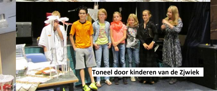
Toneel door kinderen van de Zjwiek