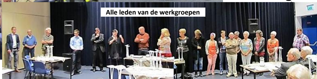
Alle leden van de werkgroepen